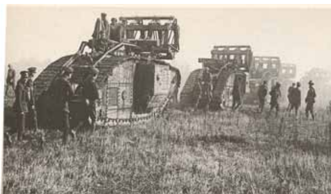
Brit harckocsik indulnak a Hindenburg-vonal ellen