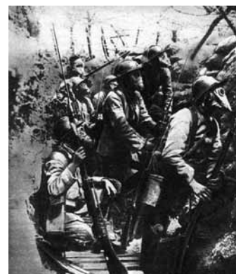
Lövészárók, az I. világháború szimbóluma