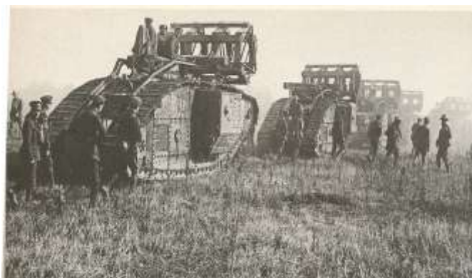
Brit harckocsik indulnak a Hindenburg-vonal ellen