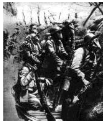
Lövészárok, az I. világháború szimbóluma