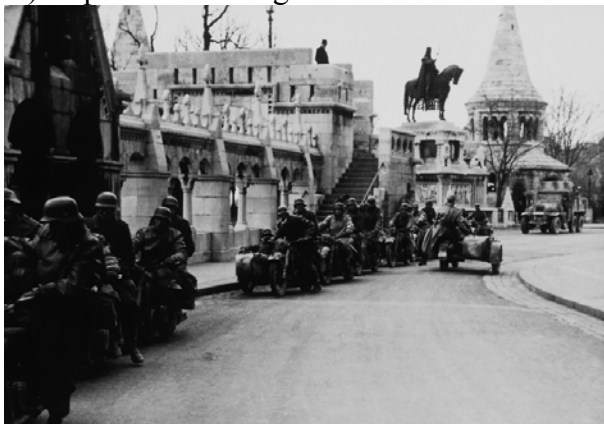
C) Német katonák a Budai várban