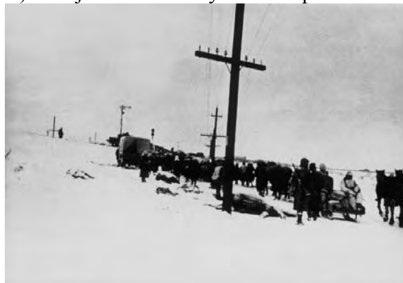
D) A második magyar hadsereg

a) Mikor készülhettek a fotók? Írja a táblázat megfelelő sorába a képek betűjelét!