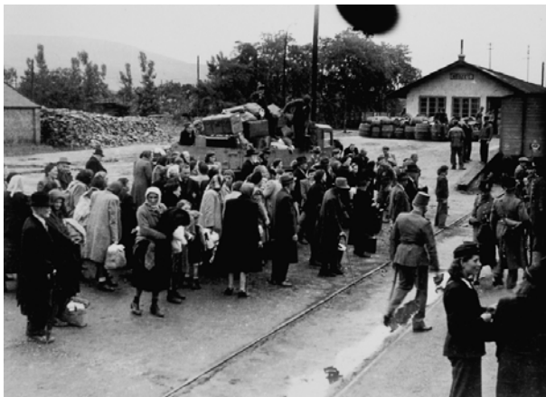
A) Deportálás Kőszegen

A képek hazánk második világháborús részvételét mutatják.