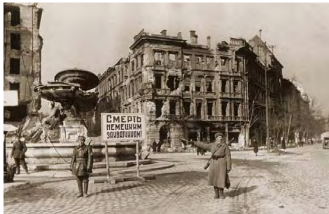
B) Szovjet katonai irányítás Budapesten